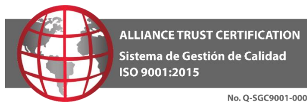
Figura 1: Distintivo 1 de empresa certificada por ATC